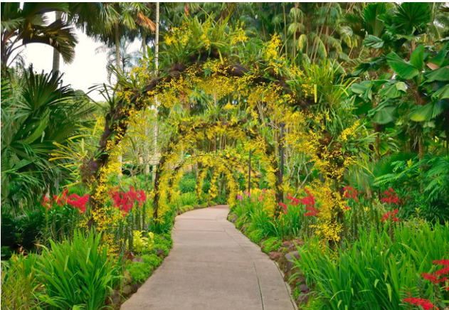
Jardín botánico de Singapur (Singapur).