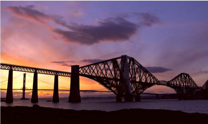
Puente sobre el río Forth (Reino Unido).