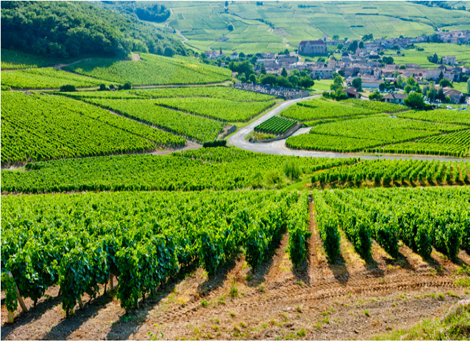
Pagos del viñedo de Borgoña (Francia).