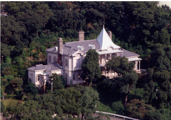
Sitios de la revolución industrial de la era Meiji en Japón: siderurgia, construcciones navales y extracción de hulla (Japón)