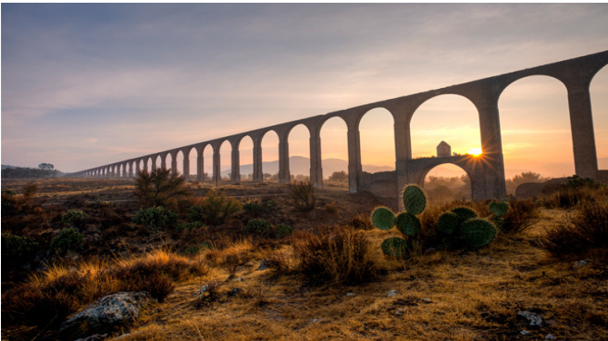
Sistema hidráulico del acueducto del Padre Tembleque (México).