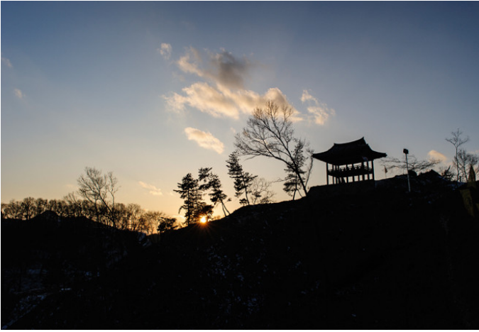
Zonas históricas del reino de Baekje (República de Corea)