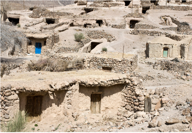
Paisaje cultural de Maymand (República Islámica del Irán).