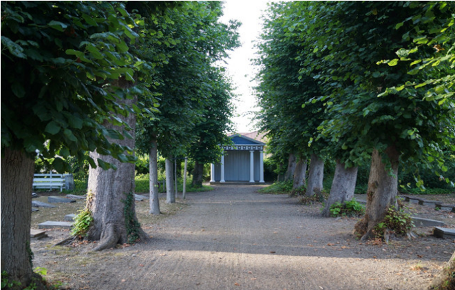
Christianfeld, una colonia de la iglesia morava (Dinamarca).