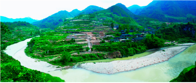
Sitios del sistema tusi (China)