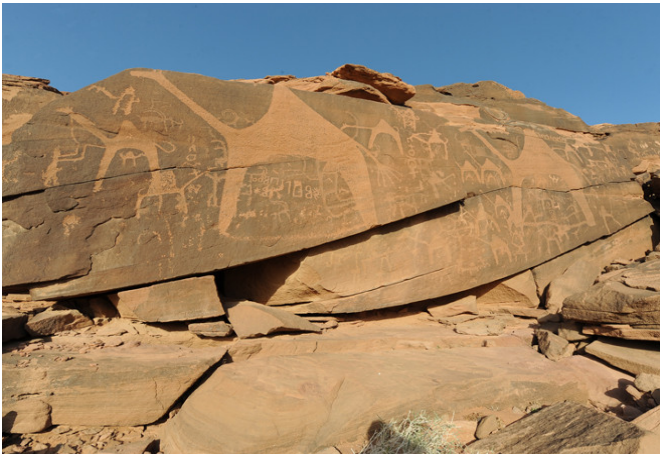
Arte rupestre de la región de Hail (Arabia Saudita)