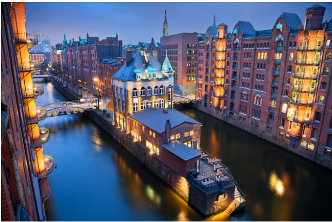
Área de Speicherstadt y barrio de Kontorhaus con el edificio Chilehaus (Alemania)

Concretamente, la Unesco ha anunciado que son 23 los sitios culturales inscritos y uno mixto, cultural y natural, los Montes azules y montes John Crow de Jamaica. Con estos nuevos inscritos la Lista de Patrimonio de la Humanidad acoge un total de 1.031 sitios repartidos en 163 países.