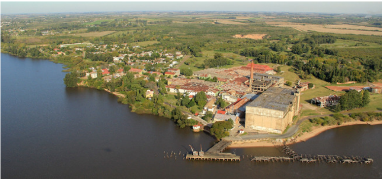
Paisaje cultural industrial de Fray Bentos (Uruguay).