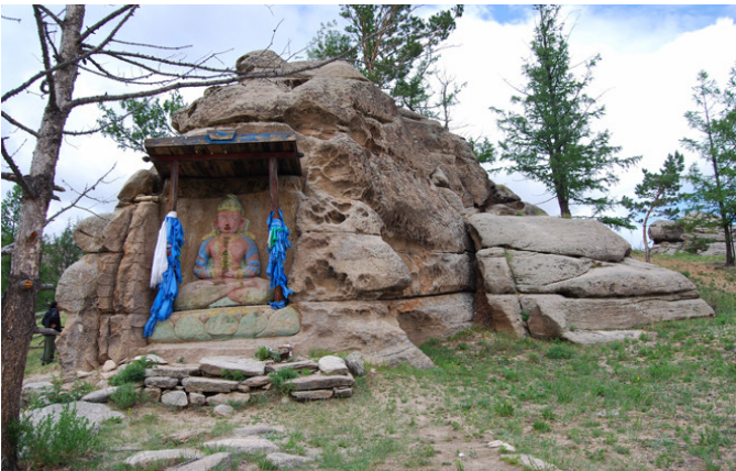
Gran montaña de Burkhan Khaldun y paisaje sacro circundante (Mongolia).