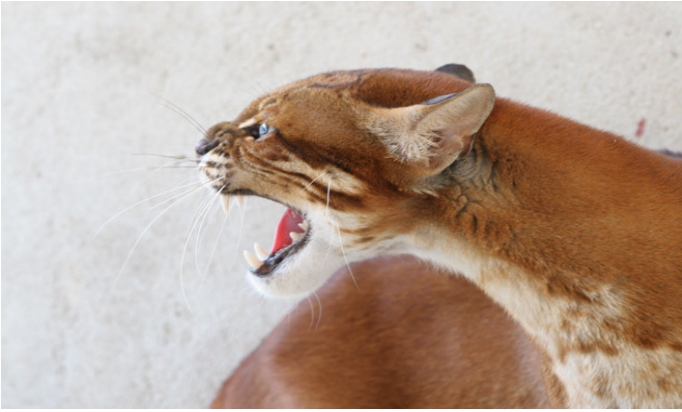
Parque Nacional de Phong Nha-Ke Bang (Vietnam)