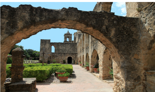
Misiones de San Antonio (Estados Unidos).