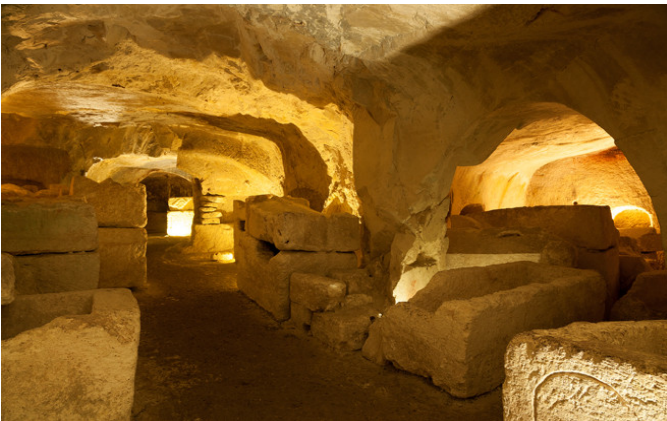
Necrópolis de Bet She'arim – Sitio histórico de la renovación judía (Israel)