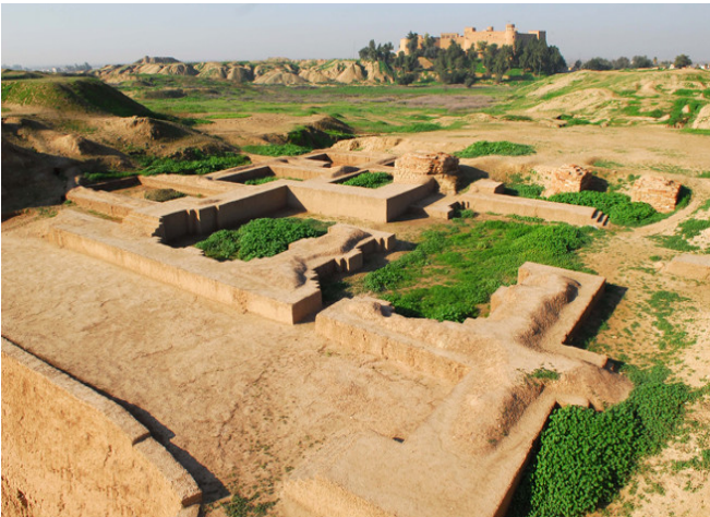
Susa (República Islámica del Irán).