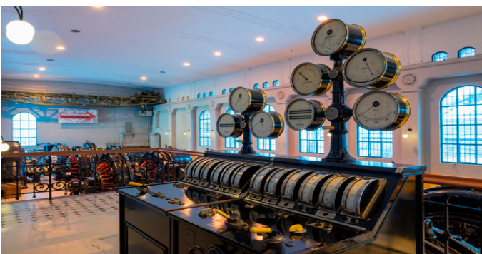
Sitio de patrimonio industrial de Rjukan-Notodden (Noruega)