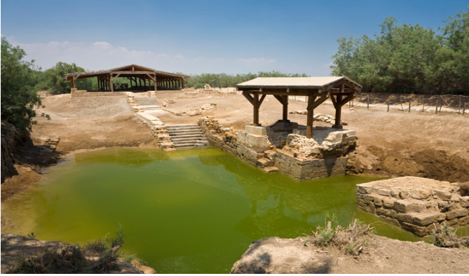
Sitio del bautismo “Betania en la otra orilla del Jordán” (Al-Maghtas), Jordania.