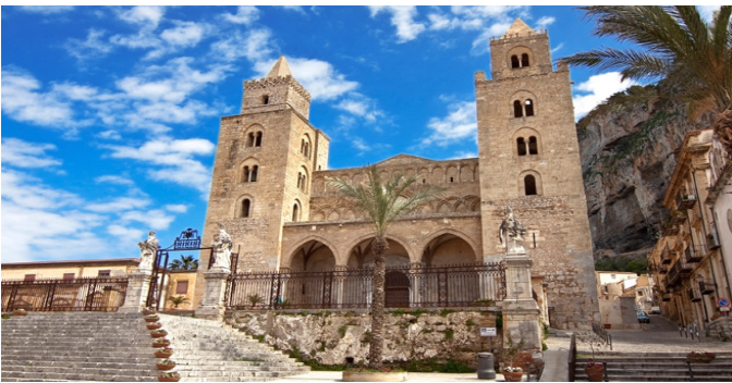
Edificios de Palermo y catedrales de Cefalú y Monreale de estilo árabe-normando (Italia).