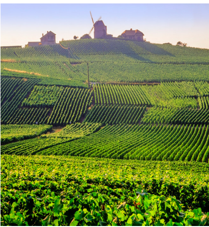
Viñedos, casas y bodegas de Champaña (Francia).