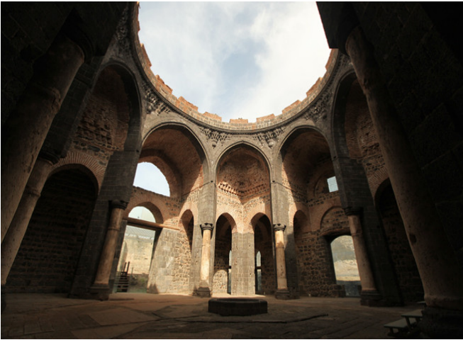
Paisaje cultural de la fortaleza de Diyarbakır y jardines del Hevsel (Turquía).