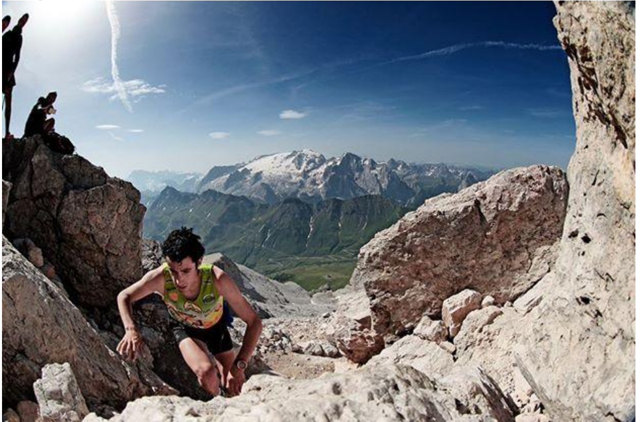
Diagonale des Fous

Se ha convertido en un icono del ultra trail a nivel mundial, además de ser la última prueba del Ultra Trail World Tour . La Isla de Reunión, situada en medio del océano Índico, acoge durante la disputa la Diagonale des Fous , también conocida como la Diagonal de los Locos, por ser una de las pruebas de montaña más exigentes. Hablamos de 172 kilómetros de recorrido y 10.000 metros de desnivel positivo. Realmente, una locura.