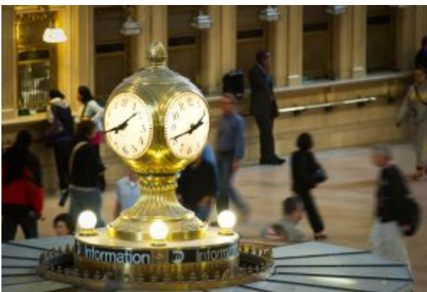
Reloj del punto de información en el vestíbulo principal de la Grand Central Terminal de Nueva York.

De estilo beaux-arts y llamada a menudo (aunque de manera incorrecta) Grand Central Station –es, en realidad, la Grand Central Terminal –, estuvo a punto de ser derruida en la década de los 50. El motivo fue el aumento del precio del metro cuadrado en Manhattan y el descenso en el uso del ferrocarril, debido al auge del automóvil, conjuntamente con la creación de nuevos lugares de residencia. Es una de las grandes obras arquitectónicas de la ciudad y una de las atracciones gratuitas que no te puedes perder.