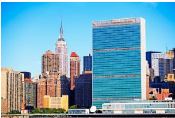
Sede las Naciones Unidas, junto al East River, en Nueva York.

Completado en 1950 en el barrio de Turtle Bay, el edificio se encuentra mirando al East River. De estilo Internacional, como el puente de Verrazano o el World Trade Center, el edificio de la ONU ofrece visitas en todos los idiomas para los cientos de turistas que quieren ver dónde se discuten las cuestiones globales más importantes.