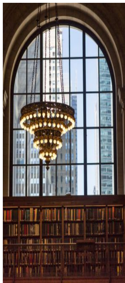
Sala de lectura de la New York Public Library.

De estilo beaux-arts, como la Grand Central Terminal, y con más de 100 años de historia, la Biblioteca Pública de Nueva York está situada justo al lado de una de las zonas verdes más conocidas de Manhattan, Bryant Park, donde siempre hay actividades al aire libre. La entrada es gratuita y abre todos los días de la semana, salvo algunos festivos y domingos en verano.