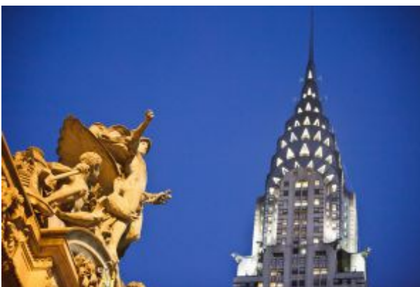
Chrysler Building, en Nueva York. / JAMES LEYNSE