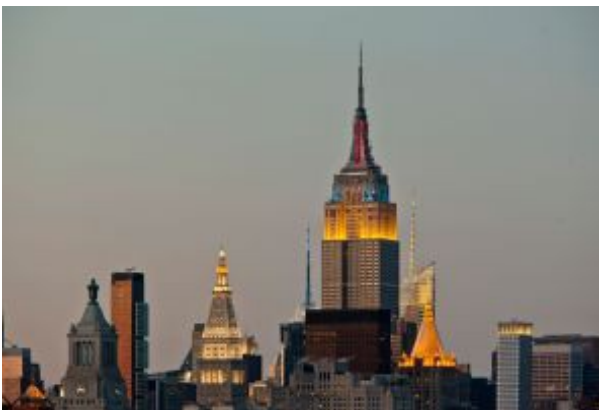
Vista del Empire State iluminado al atardecer, en Manhattan (Nueva York).

Construido en 1934 entre las calles 33 y 34, es una de las obras más importantes del art déco con sus 381 metros de altura y más de 6.500 ventanas. El Empire State terminó de construirse en 1972 y está considerado por la Asociación de Ingenieros americanos como una de las 7 maravillas mundiales del arte moderno. Uno de sus mayores atractivos es su observatorio, que permite contemplar toda la ciudad gracias a su estratégica situación.