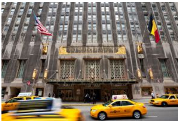
Hotel Waldorf Astoria, en Nueva York.

Representación del lujo por excelencia, este icónico hotel art déco está pegado a Central Park, en una de las zonas más exclusivas de la ciudad.