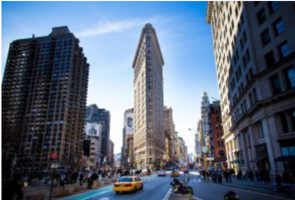
Vista del edificio Flatiron, en Manhattan (Nueva York).

Uno de los edificios más característicos y bonitos de Nueva York por su particular diseño en forma de plancha (visto desde arriba), fue concluido en 1902 por Daniel Burnham y pertenece al estilo de Chicago. Es famoso también por el microclima que generó el Flatiron en sus alrededores cuando se estaba construyendo: debido a su estructura fina y triangular, al tener la calle Broadway por un costado, la quinta Avenida por el otro y el parque de Madison Square junto enfrente, generaba corrientes de aire tan fuertes