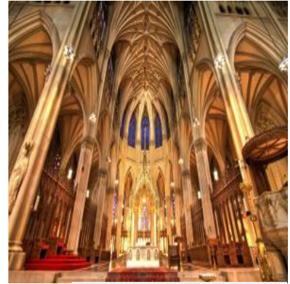
Interior de la catedral de San Patrick's, en Manhattan (Nueva York).

De estilo neogótico y construida en piedra, es la catedral católica más grande de Norteamérica. Se puede visitar de manera gratuita, únicamente aportando la voluntad, desde las 10 de la mañana, aunque también se pueden concertar tours guiados .