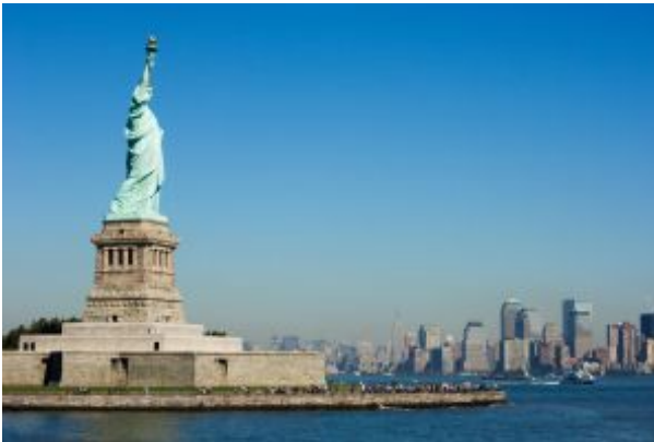
La Estatua de la Libertad y, al fondo, la isla de Manhattan, en Nueva York.

Esta gran escultura de tipo neoclásico, donada por Francia en 1886 para sellar su amistad con el estado norteamericano, fue esculpida por Frédéric Auguste Bartholdi y daba la bienvenida a los barcos cargados de emigrantes que arribaban a Nueva York en otras épocas. Se puede visitar e incluso subir a su corona, aunque es necesario reservar las entradas con bastante antelación.