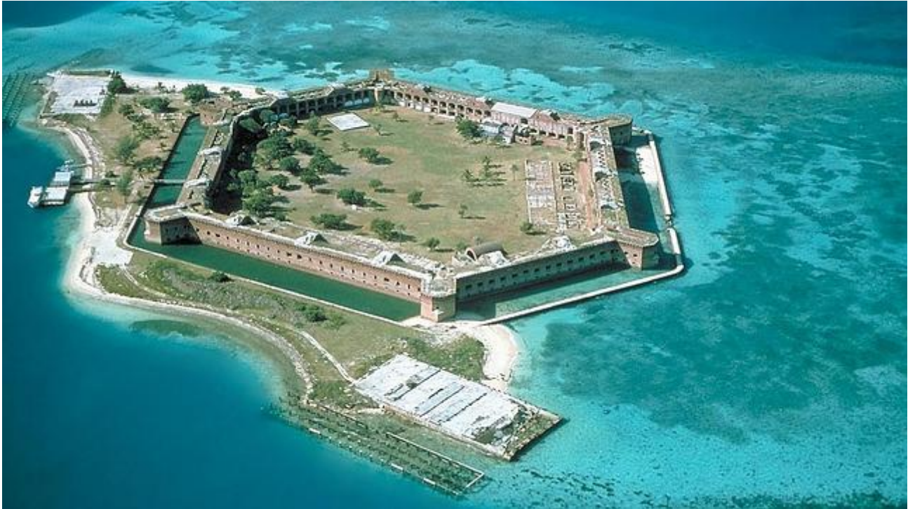
Fort Jefferson, en las Dry Tortugas

Fort Jefferson es una enorme fortaleza (al parecer, se utilizaron 16 millones de ladrillos hecho a mano) construida en 1847. Nunca llegó a terminarse por completo. Toda la zona (Dry Tortugas, Florida) es realmente espectacular. Son siete islas en los que se aprecia una rara combinación de recursos naturales e históricos. Hay playas perfectas, arrecifes de coral y también esta extraña fortaleza -en principio pensada para proteger estas aguas estratégicas para Estados Unidos- en la que cumplió condena el Dr. Samuel Mudd , encarcelado por su participación en el asesinato del presidente Abraham Lincoln. El fuerte estuvo en manos federales durante la Guerra Civil, y alojó a presos y desertores. El 26 de octubre de 1992, el monumento fue declarado parque nacional en un proyecto de ley firmado por el presidente George Bush.