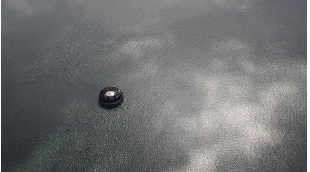
No Man's Land Fort