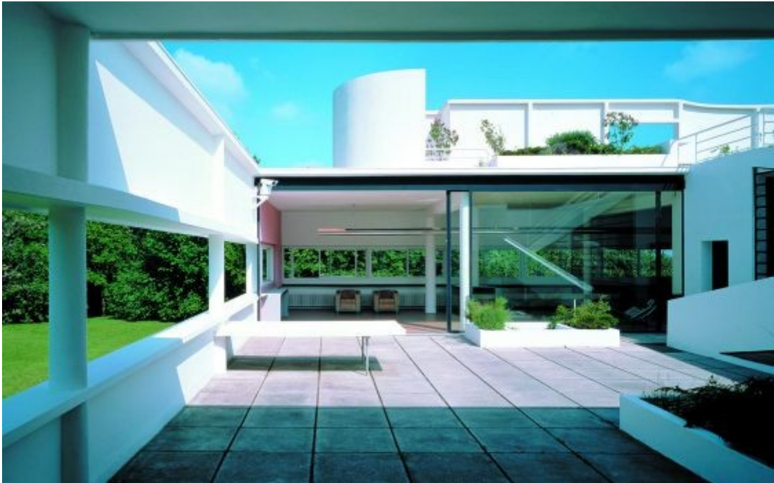
Terraza de Villa Savoye (1929-1931), vivienda de Le Corbusier en Poissy (Francia).

Para los aficionados a la arquitectura, el diseño y el interiorismo hay algunas casas que son una auténtica tentación. No son monumentos, ni siquiera son museos o casas-museo. Simplemente son auténticas obras de arte , adscritas al Movimiento Moderno o herederas de los principios de este grupo que transformó las formas de vivir, construidas por los mejores arquitectos del siglo pasado. Merecen una visita por su peculiar arquitectura o simplemente por haber sido el hogar de algunos de los mejores arquitectos del siglo XX.