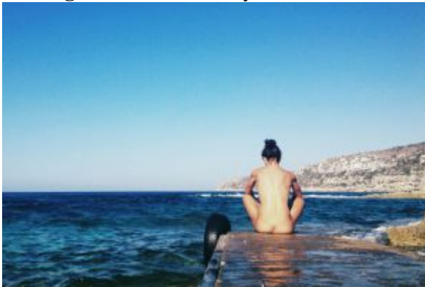
Una mujer tomando en sol en Formentera (Islas Baleares).