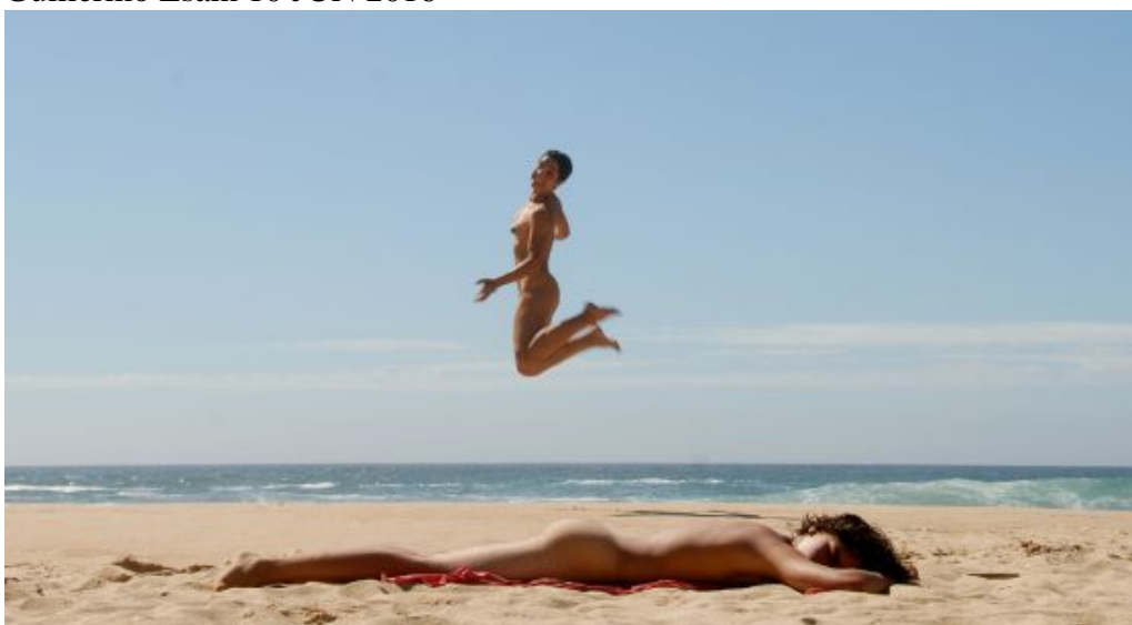
Dos mujeres en una playa nudista.

La más dichosa posesión del mundo. Así describe el poeta valenciano Francisco Brines la experiencia de desnudarse junto al mar. Es difícil imaginar otra inmersión tan íntima en la naturaleza. Curiosamente, los textiles se están asomando cada vez más a las playas nudistas más conocidas, y los naturistas asiduos, que rondan el medio millón en España, se lanzan a la búsqueda de nuevos paraísos particulares, como estos 12 que proponemos. La nueva frontera.