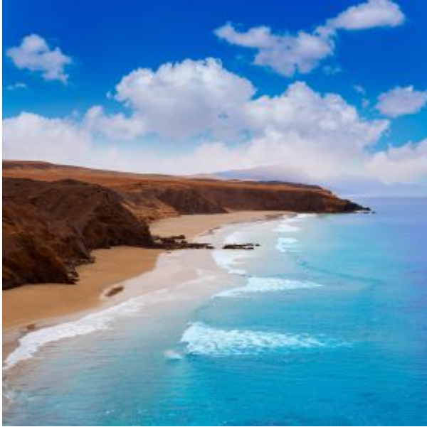
La playa de La Pared, en Jandía (Fuerteventura).