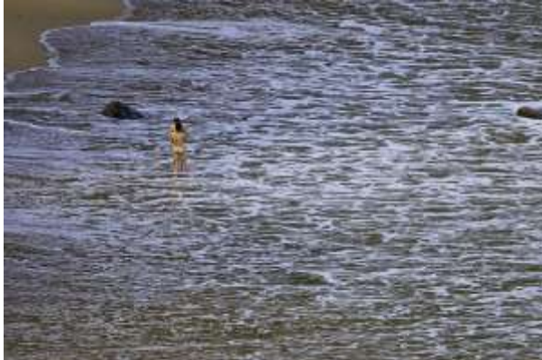
Nudistas en la playa de Barrika (Bizkaia), a 6 kilómetros de la playa de Azkorri.

Se trata de una playa resguardada del viento, en la que conviven armoniosamente textiles y unos pocos cuerpos al sol, pero en la que hay que desconfiar de las resacas (atender a la bandera de aviso). En la parte de la izquierda, un roquedo apantalla la escueta banda nudista. Las piedras superan cada vez más en número a la arena, pero contamos con el apoyo logístico de la fabada del restaurante El Verano (985 89 24 65) y del hotel rural La Sigar ( www.hotellafigar.com ).