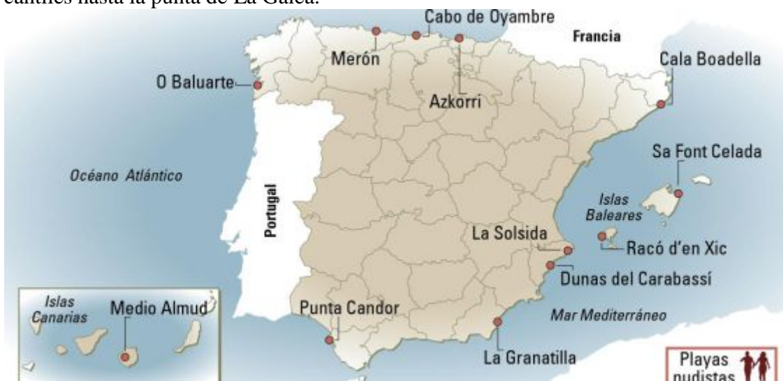
Mapa de 12 playas nudistas de España. / Javier Belloso

“Escondida” y “bien señalizada” suelen ser términos antitéticos en las pautas de conducta playero-naturistas. Y, sin embargo, es difícil imaginar una conjunción más completa en el caso de la playa de Azkorri, o Gorrondatxe, señalizada tras salir de la BI-367 hacia Getxo-Berango (luego dirección Getxo). Del amplio aparcamiento tomamos la bajada que salva los acantilados de La Galea alejándonos del bullicio del Gran Bilbao. Playa de 844 metros donde prima antes la piedra que la arena, razón por la que no puede compararse en popularidad con el sector naturista —rebosante de arena— de la vecina playa de Barinatxe. Azkorri acentúa su tranquilidad al no usarla los centros de turismo activo. Hasta el momento de la puesta de sol, es recomendable bordear los cantiles hasta la punta de La Galea.