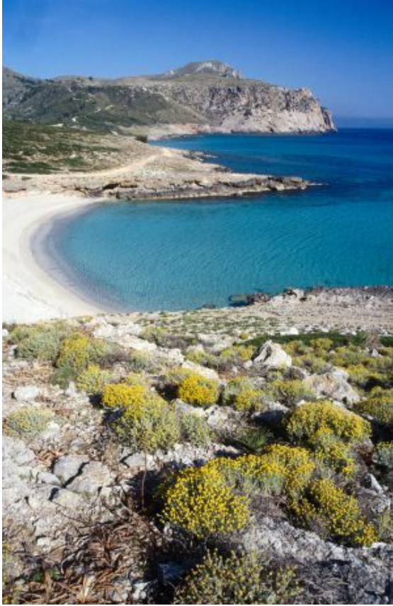
Playa de Sa Font Celada, en Artà (Mallorca).