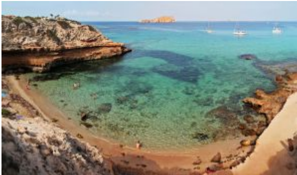
Racó d'en Xic, San José (Ibiza).

Imanta esta joya costera de Alicante: dunas embrionarias, móviles, semifijas, fijas y fósiles. La ancha pasarela de acceso de 700 metros da idea de la magnificencia dunar; si en la bifurcación seguimos por la derecha nos toparemos con 900 metros de playa para los que ofrecen la desnudez sin problemas. Hay chiringuito y todos los servicios que acredita todo arenal de bandera azul. El Carabassí registra un alto grado de ocupación, el agua se presenta limpia; y en su término sur, un pinar satisface a los devotos de la siesta. La visión de la isla de Tabarca y de los parapentistas gravitando sobre el cabo de Santa Pola, tan placentera, se ve enturbiada por la presencia de Gran Alacant, urbanización usurpadora de la montaña. Para llegar: en El Altet tomar dirección a Arenales del Sol.