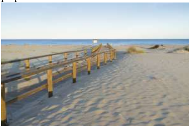
Las dunas del Carabassí, en Elche (Alicante).

La más dichosa posesión del mundo. Así describe el poeta valenciano Francisco Brines la experiencia de desnudarse junto al mar. Es difícil imaginar otra inmersión tan íntima en la naturaleza. Curiosamente, los textiles se están asomando cada vez más a las playas nudistas más conocidas, y los naturistas asiduos, que rondan el medio millón en España, se lanzan a la búsqueda de nuevos paraísos particulares, como estos 12 que proponemos. La nueva frontera.