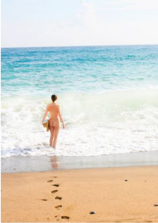
Playa de Vera, Almería.