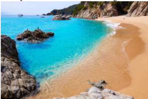
Cala Boadella, en Lloret de Mar (Girona).

Un claro objeto de deseo cuya llegada causa fatiga: justo lo que adora el bañista naturista. El coche hay que dejarlo poco antes de Cala Mitjana (sin objetos de valor). Caminaremos 90 minutos costeadando las sinuosidades del parque natural de la Península del Levante, evitando las horas centrales del día. Borearemos la cala Es Matzoc, subiremos la torre de Aubarca (y así vemos su cañón), para rendir viaje en Sa Font Celada, de verdiazules incandescentes, de una virginidad tal, que su blanca superficie no es sino un cúmulo de caparazones y vestigios coralinos, microorganismos dignos de escrutarse con lupa, tan exótico como nuestras huellas sobre la arena. Unos tamarindos nos separan de S'Arenalet. Llevar agua de sobra y protección solar.