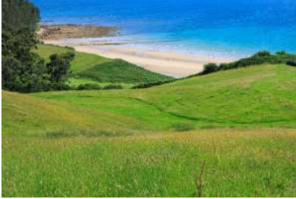
Extremo de la playa de Oyambre, en San Vicente de la Barquera (Cantabria).