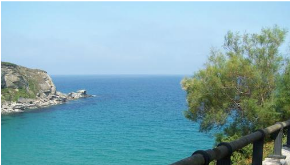
Vistas desde el parque de Mataleñas- TURISMO CANTABRIA

Se trata de un parque urbano, un poco alejado del centro de la ciudad, en las inmediaciones del Faro de Cabo Mayor. Destaca la belleza natural del paraje, con árboles y un pequeño zoológico. Tiene acceso directo a las playas de Mataleñas y Los Molinucos.