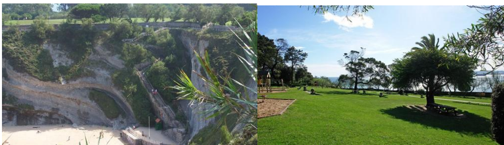
Acceso a la playa desde el parque-

Se trata de un parque urbano, un poco alejado del centro de la ciudad, en las inmediaciones del Faro de Cabo Mayor. Destaca la belleza natural del paraje, con árboles y un pequeño zoológico. Tiene acceso directo a las playas de Mataleñas y Los Molinucos.