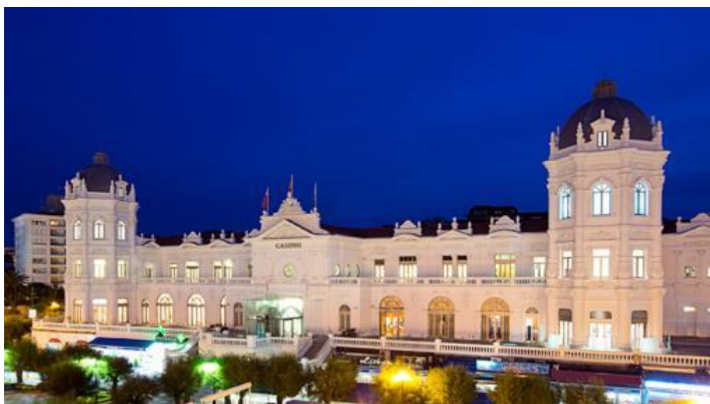
Vista nocturna del Casino- GRAN CASINO SARDINERO

En la Plaza de Italia (en El Sardinero) se encuentra el imponente edificio blanco que alberga el Casino de Santander . Se trata de uno de los edificios más llamativos de la ciudad, por su tamaño, y de noche por la iluminación de colores que aplican a la fachada. Se trata de un ejemplo de arquitectura de la Belle Epoque, momento de máximo esplendor de la ciudad. Construido en 1916, en solo un año, tiene una gran escalinata y terrazas. Entre 1939 y 1978 permaneció cerrado, pero después de su restauración está abierto al público y tiene local de juego, cafetería, restaurante, sala de fiestas y sala de exposiciones.