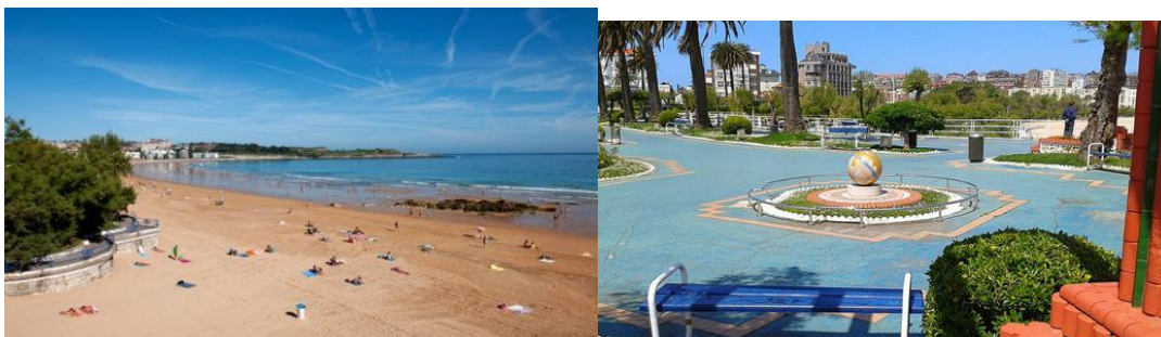
Playa de El Sardinero- TURISMO DE CANTABRIA

Es un barrio y un enclave turístico de Santander, famoso por sus playas y por ser un lugar exclusivo con jardines, edificios y rincones singulares, así como hoteles y restaurantes a pie de playa. El recorrido por el paseo marítimo va desde la península de la Magdalena hasta la Segunda playa de El Sardinero, delante del hotel Chiqui. Entre estos dos puntos están: