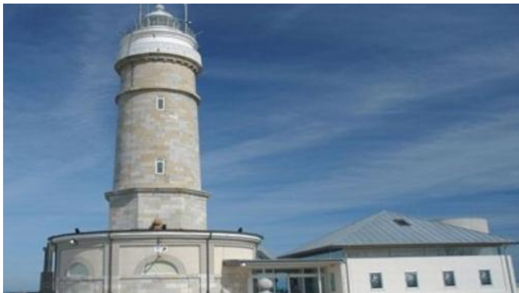
Faro de Cabo Mayor

El faro se encuentra en el extremo noroeste de la ciudad, en la entrada de la bahía. Fue encendido por primera vez en 1839 , desde donde tradicionalmente se hacían señales a los barcos, con pañuelos de día y con fuegos de noche. Se encuentra en el área de Cabo Mayor y Cabo Menor, con una morfología peculiar por el relieve accidentado y las playas y acantilados que dan al mar. Las vistas desde este promotorio son increíbles tanto hacia el Cantábrico y alta mar como hacia la ciudad de Santander y su bahía.