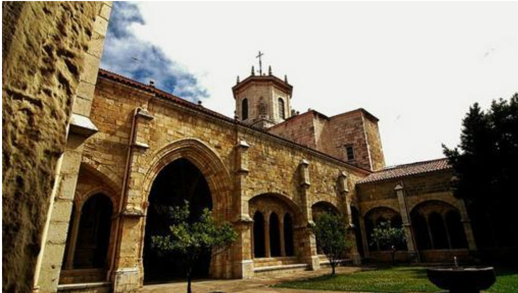
Interior del claustro de la catedral de Santander- ENRIQUE LÓPEZ-TAMAYO

La Catedral de la Asunción de Nuestra Señora está sobre una colina, en el lugar sobre el que en su día se levantó la Abadía de San Emeterio y San Celedonio (también conocida como Abadía de los Cuerpos Santos), alrededor de la que nació la ciudad de Santander. La construcción de la parte baja ( Iglesia del Cristo ) data del siglo XII y es lo más antiguo de la ciudad, en su subsuelo se encontraron restos romanos (Santander es la antigua Portus Victoriae). El grueso de la catedral es del siglo XIII, pero ha sufrido transformaciones posteriores.