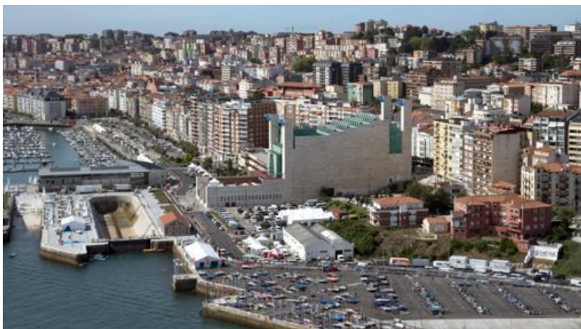
Palacio de Festivales con Santander al fondo- PALACIO DE FESTIVALES

Este edificio es el mayor foco cultural de Cantabria desde 1985 , por su programación de máxima calidad. Además de los contenidos que ofrece, el palacio es conocido por su arquitectura vanguardista , que aunque ahora ya asimilada en el paisaje, fue un impacto para el entorno clásico y tradicional en el que se encuentra. Desde el palacio también se pueden contemplar unas increíbles vistas de la bahía. En el interior cuenta con varias salas que pueden verse en la visita virtual y pueden concertarse citas para visitas guiadas.