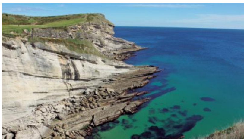
Entorno del faro

El faro se encuentra en el extremo noroeste de la ciudad, en la entrada de la bahía. Fue encendido por primera vez en 1839 , desde donde tradicionalmente se hacían señales a los barcos, con pañuelos de día y con fuegos de noche. Se encuentra en el área de Cabo Mayor y Cabo Menor, con una morfología peculiar por el relieve accidentado y las playas y acantilados que dan al mar. Las vistas desde este promotorio son increíbles tanto hacia el Cantábrico y alta mar como hacia la ciudad de Santander y su bahía.