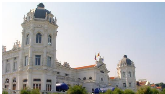
Fachada del Casino- GRAN CASINO SARDINERO

En la Plaza de Italia (en El Sardinero) se encuentra el imponente edificio blanco que alberga el Casino de Santander . Se trata de uno de los edificios más llamativos de la ciudad, por su tamaño, y de noche por la iluminación de colores que aplican a la fachada. Se trata de un ejemplo de arquitectura de la Belle Epoque, momento de máximo esplendor de la ciudad. Construido en 1916, en solo un año, tiene una gran escalinata y terrazas. Entre 1939 y 1978 permaneció cerrado, pero después de su restauración está abierto al público y tiene local de juego, cafetería, restaurante, sala de fiestas y sala de exposiciones.