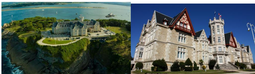
Vista del Palacio- PALACIO DE LA MAGDALENA

El palacio fue construido entre 1909 y 1911 por suscripción popular para la Familia Real , es decir, por el ayuntamiento y familias de la zona que hicieron una especie de micromecenazgo. Pasó a ser la residencia de verano de Alfonso XIII y su familia, que lo disfrutaron hasta la proclamación de la II República en 1931 . La propia Reina, Victoria Eugenia de Battemberg , dirigió la decoración.