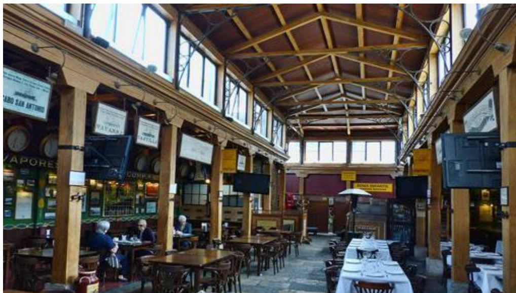
Interior del Mercado del Este- JUAN TIAGUES

En el centro del casco urbano de Santander, junto a la Plaza Porticada y próximo al Paseo de Pereda. También conocido como plaza del Este, data de 1839-1842 . Se trata de una de las primeras galerías para uso comercial, pues es un entramado de vías en trazo damero a modo de calles cubiertas. La estructura está pensada para respetar la iluminación y la ventilación adecuadas, por lo que se puede decir que es un edificio avanzado a su época. Ocupa 2.690 metros cuadrados y en 1986 fue declarado bien de interés cultural .