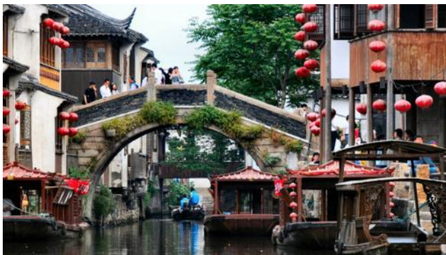
Calle-canal de Shantang-

Como en Venecia, es una calle y canal a la vez. Se encuentra en la ciudad de Suzhou, Jiangsu, famosa por su urbanismo, jardines y canales. Esta vía en concreto fue obra del poeta Bai Juyi, de la dinastía Tang (618-907), quien fuera nombrado gobernador de la ciudad. El puente Bantang atraviesa el canal en su parte media y conduce a dos calles peatonales a ambos lados de la corriente. Ideal para caminar sin prisas deteniéndose en las tiendeceitas, los templos y los puestos ambulantes.