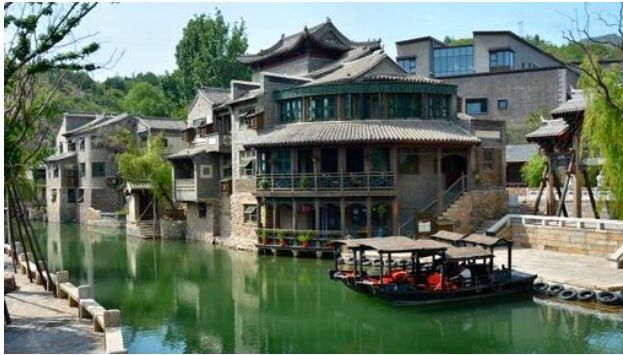
Villa acuática de Gubei-

A solo 120 km. de Pekín, Gubei es una de las llamadas «villas acuáticas», un pueblo típico construido en torno a una red de canales y regueras. Algunos la comparan con la famosa Wuzhen, la «Ciudad de los Puentes» cercana a Shanghai. Con varios siglos de antigüedad a sus espaldas, aunque parece que fue construida ayer a causa de una profunda y reciente restauración, en 2014 fue abierta al turismo. Desde sus calles se ve la cresta de la Gran Muralla en su sección de Simatai, una de las más salvajes y menos frecuentadas por los turistas.