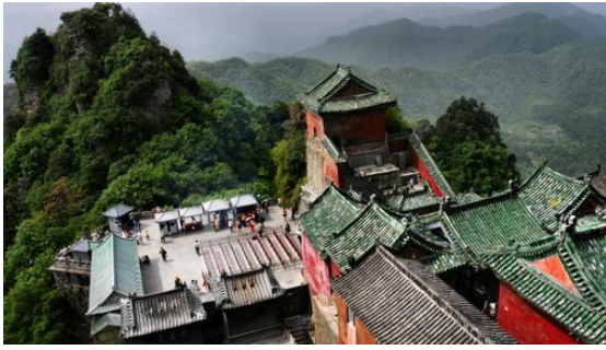
Montaña Sagrada de Wudang-

En China hay más de cien montañas íntimamente relacionadas con el taoísmo, entre ellas, la más sagrada es la de Wudang. Estamos en el centro-este de China, en la provincia de Hubei. Destaca con su tejas verdes y muros rojos, el Templo Dorado del Pico Tianzhu. Más que una única montaña, Wudang es una cordillera de 30 km 2 en la que hay 72 picos, 36 acantilados y barrancos, 24 arroyos, 11 grandes cuevas, 3 estanques... cubiertos por una exuberante vegetación en la que crecen 600 tipos de hierbas, muchas de ellas medicinales. Y todo ello salpicado por varios templos taoístas , la única religión genuinamente china.