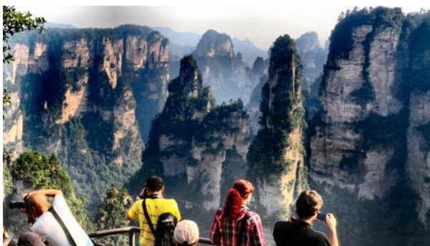
Montañas de Zhangjiajie-

El cineasta James Cameron se inspiró en estas montañas para crear los escenarios de su película Avatar. El Parque Nacional Forestal de Zhangjiajie, en la provincia de Hunan, fue en 1982 el primer parque nacional declarado por el gobierno chino y en 1992 pasó a formar parte de la lista de Patrimonio Natural Mundial de la Unesco. Desde algunos de sus miradores, los turistas se sienten dentro de las «Montañas Flotantes Aleluya» del planeta Pandora.