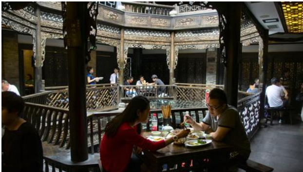
Restaurante en el Callejón Estrecho (Zhaixiangzi) de Chengdú-

En Chengdú reza un proverbio que « hay pocos días soleados, pero muchas casas de té ». Capital de Sichuan, en el suroeste de China, es la cuna de una de las gastronomías más importantes del país. Por toda la ciudad hay restaurantes, cafeterías, bares, casas de té... sobre todo en el centro histórico a lo largo de dos vías peatonales conocidas como el Callejón Ancho (Kuanxiangzi) y el Callejón Estrecho (Zhaixiangzi), que datan de la dinastía Ming (1368-1644) y Qing (1644-1911). Lugares recoletos, escondidos, que el turista debe descubrir por sí mismo.