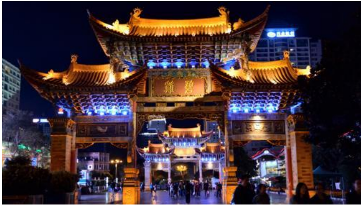
Puertas Jinma Biji Fang-

En Kunming, la Ciudad de la Eterna Primavera, capital de Yunnan, hay dos grandes puertas en forma de arcos tradicionales (paifang) construidas hace cuatro siglos en plena dinastía Ming (1368-1644). Se llaman Jinma y Biji, que literalmente quiere decir Caballo Dorado y Gallo de Jade. Fueron levantadas con una precisión tal que en fechas muy concretas (equinoccio de otoño y festival del medio otoño) y cada 60 años, la luz del sol del atardecer provoca unas sombras que se superponen. A partir de ellas se extiende un barrio peatonal, que recuerda en cierta medida al Yuyuan de Shanghái, cuajado de tiendas, bares y restaurantes, tan concurrido de día como por la noche.