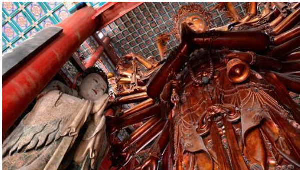
Gran Buda de Chengde-

Está prohibido fotografiarlo, pero ¿quien pone puertas al campo fotográfico en la era del smartphone? Es un Buda (Bodhisatva) de madera de casi 23 metros de altura y 110 toneladas de peso. Se encuentra dentro de una pagoda de cinco pisos llamada Puning (Paz Universal), que forma parte del complejo de los Ocho Templos Exteriores en la ciudad de Chengde, a 226 km. de Pekín, lugar de veraneo de los emperadores de la dinastía Qing.