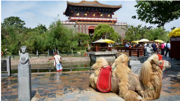
Parque del Río Qingming-

Durante la dinastía Song del Norte (960–1127), la ciudad de Kaifeng, provincia de Henan, no sólo fue la capital política, sino también la ciudad más grande de toda China. Uno de sus paisajes más famosos aparece en la célebre pintura de Zhang Zeduan (1085–1145) titulada «Festival Qingming a orillas del río», que representa la vida cotidiana durante la dinastía Song. Basándose en ella se ha construido El Parque del Río Qingming.