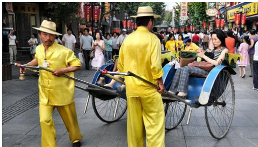
Rickshaws de Nanjing-

Nanjing, cuya transcripción anterior era Nankín, significa literalmente «Capital del Sur», frente a Pekín «Capital del Norte». Fue una de las cuatro capitales principales de la antigua China. En ella en 1912 Sun Yat-sen proclamó la República de China. Atravesada por el río Yangtsé , es una gran ciudad (más de 8 millones de habitantes) con algunos remansos de paz, como el Templo de Confucio del s. XI. Junto a él, en pleno casco viejo, hay una zona comercial peatonal que se puede recorrer en rickshaw, carricoches de dos ruedas tirados a mano por porteadores vestidos con uniformes de color amarillo chillón.