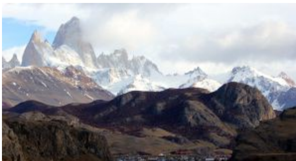
Monte Fitz Roy.

Pasamos a una ruta de mayor dificultad, ya que requiere unas cinco horas para completarla. Se trata de la propuesta senderista más conocida, ya que desemboca frente al monte Fitz Roy y al glaciar Los Tres. Antes de salir, conviene informarse sobre el estado del camino en el punto de información turística, ya que en ocasiones sus pendientes están cubiertas de nieve y puede resultar peligroso.