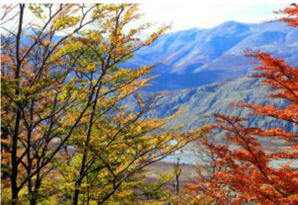
Valle del río de las Vueltas.

El pueblo fue fundado para aprovechar el turismo del Parque Nacional Los Glaciares , donde se encuentra el famoso Perito Moreno. La opción preferida por la mayoría de los turistas es llegar aquí desde El Calafate, a unas tres horas y media en coche. Los más aventureros pueden realizar una ruta desde Bariloche, situada a unas 17 horas por carretera.