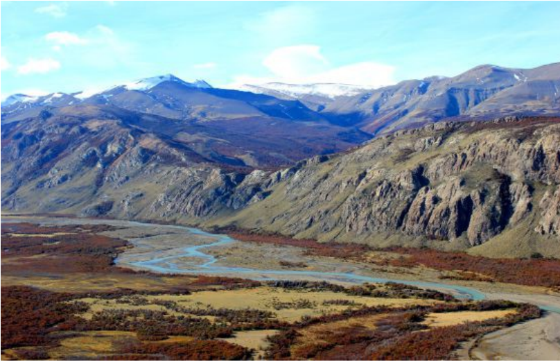
Valle del río de las Vueltas, en los alrededores de El Chaltén, en Argentina

El Chaltén suena a nombre de película. Ubicada al sur de la cordillera de los Andes , la pequeña población argentina -apenas 1.600 habitantes- permite entrar en contacto con la naturaleza de la Patagonia . El otoño es una buena época para descubrir la pureza de su aire, la sensación de tranquilidad, el relajante sonido de las corrientes de viento y los contrastes de colores de sus paisajes. Proponemos varias rutas a pie por la conocida como capital argentina del senderismo .