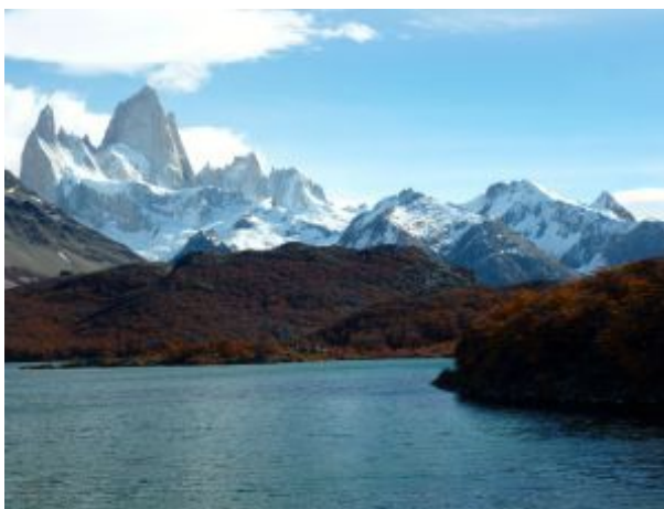
La laguna Capri, con el monte Fitz Roy al fondo. / J. SÁNCHEZ

No hay muchos senderos que permitan ver tantas cosas en tan poco tiempo. Calculando unas dos horas desde la salida de El Chaltén, la ruta ofrece miradores para observar el arroyo de El Salto, con la estepa patagónica y las montañas nevadas de fondo. En el camino hay gran variedad de árboles y sobrevuelan distintas aves. Como colofón, una espectacular laguna de color azul glaciar que refleja los picos del monte Fitz Roy, también conocido como Cerro Chaltén.