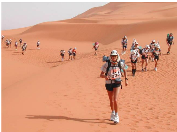
Maratón des Sables. (CC)

La Maratón des Sables no podía faltar en esta lista, una de las carreras más duras del planeta que se celebra en parte del desierto del Sáhara . El inicio de esta competición se remonta a 1984, cuando Patrick Bauer se lanzó a cruzar 350 kilómetros del Sáhara en autosuficiencia, en solitario, a pie y cargando con una mochila de 35 kilogramos, empleando un total de 12 días para completar el recorrido.