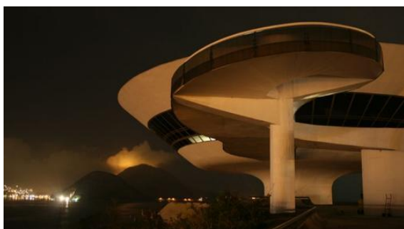
Vista nocturna del Museu de Arte Contemporânea de Niterói

Peter Exley, profesor de la School of the Art Institute of Chicago y fundador de Architecture is Fun: «El MAC cuelga sobre el agua, una simple colección de líneas y curvas inspiradas en las flores que crecen en el paisaje de Río de Janeiro».