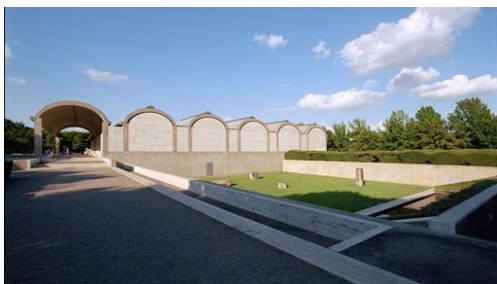
Kimbell Art Museum, en Fort Worth