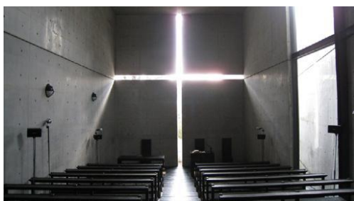
Iglesia protestante Ibaraki Kasugaoka-