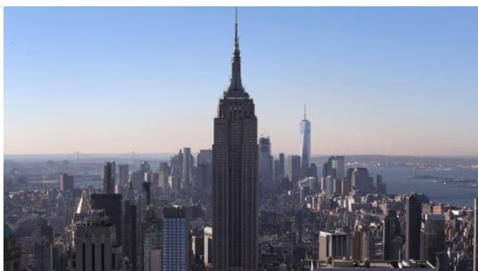
Empire State Building, fotografiado en noviembre de 2016